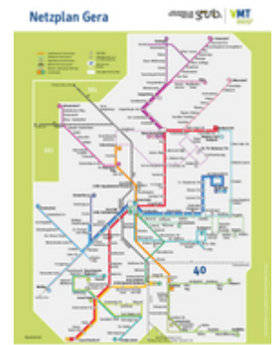
GVB-Liniennetzplan ab 08-2018

Dieses "Taktgefühl" erleichtert das Umsteigen und verkürzt die Fahrtzeiten selbst auf verschlungenen Wegen.